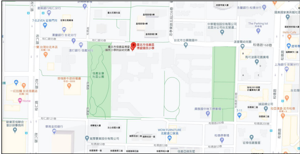
地址：臺北市信義區松仁路 95 巷 20 號